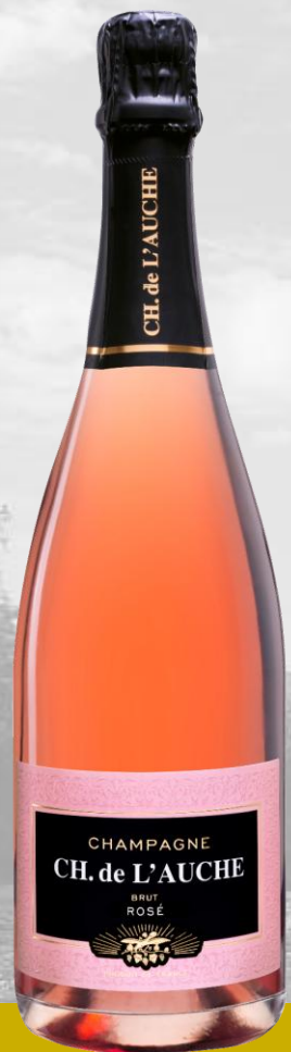
CH. DE L'AUCHE Brut Rosé