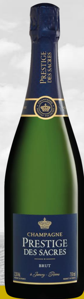
PRESTIGE DES SACRES Brut