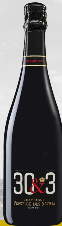
30&3 Extra Brut

Viticultores de la ladera occidental de la Montagne de Reims, con 115 hectáreas de viñedos en 40 crus diferentes (incluidos 5 premiers crus).