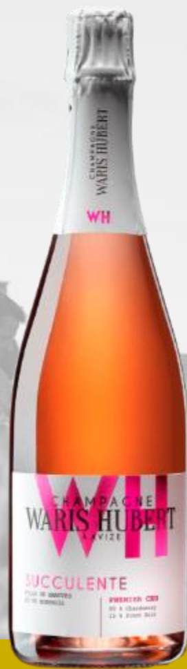
SUCCULENTE Premier Cru