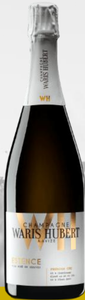
ESTENCE Premier Cru