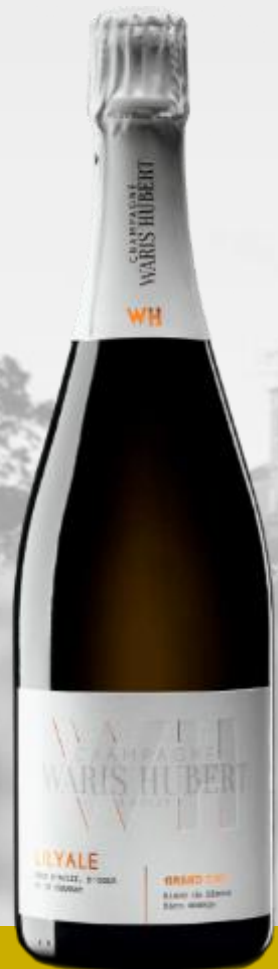
LILYALE Grand Cru